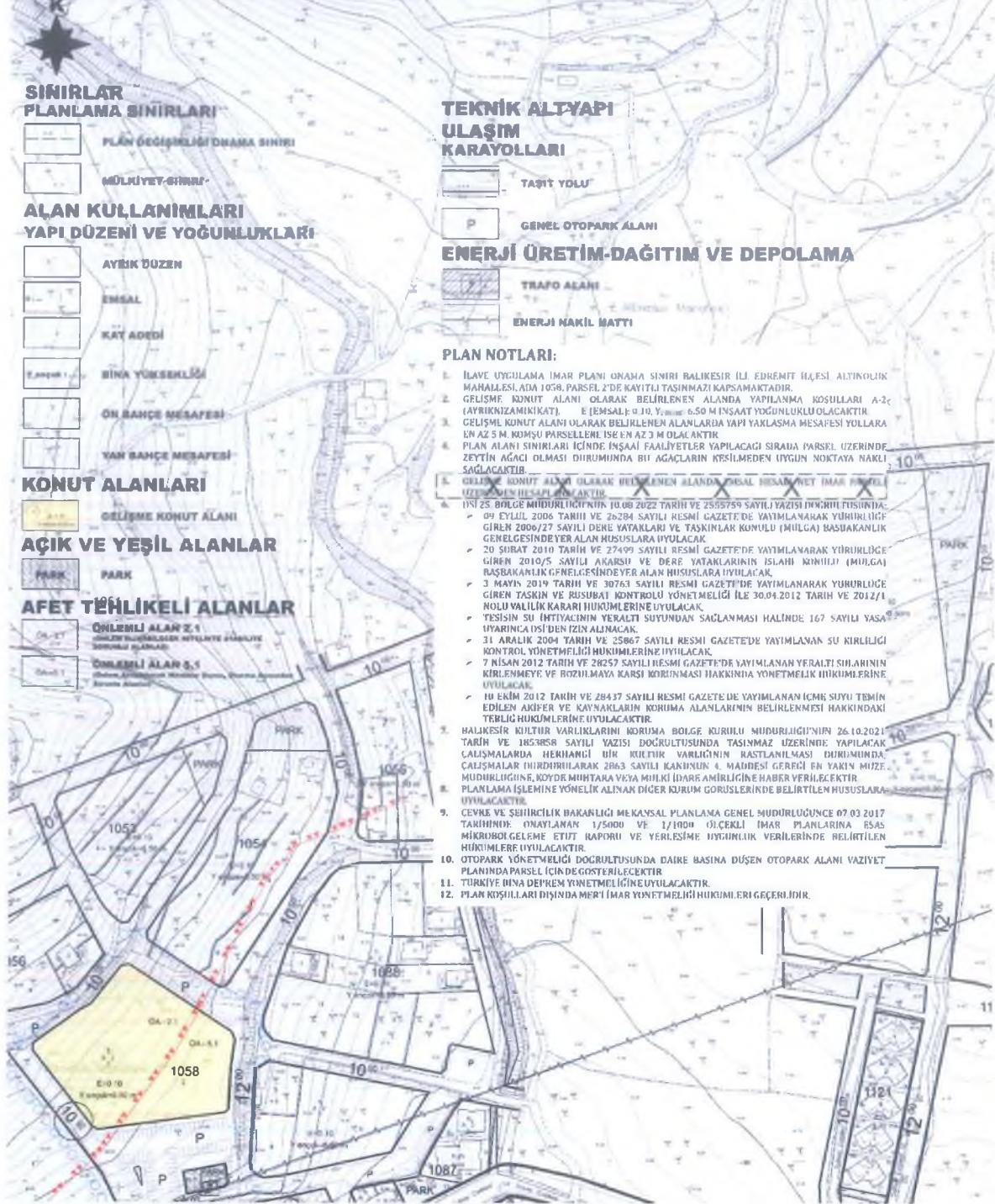
Şekil 14. Planlama Alanı - 1/1000 Ölçekli Uygulama İmar Planı Plan Notu Değişikliği.