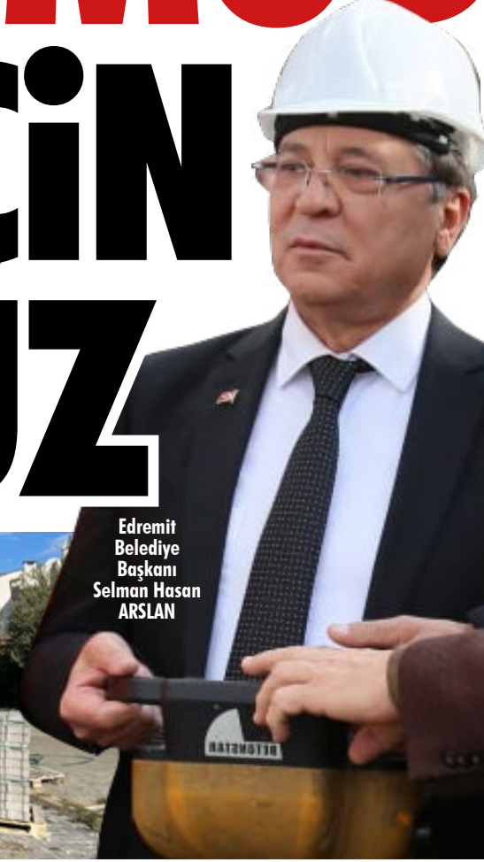
Edremit Belediye Başkanı Selman Hasan ARSLAN