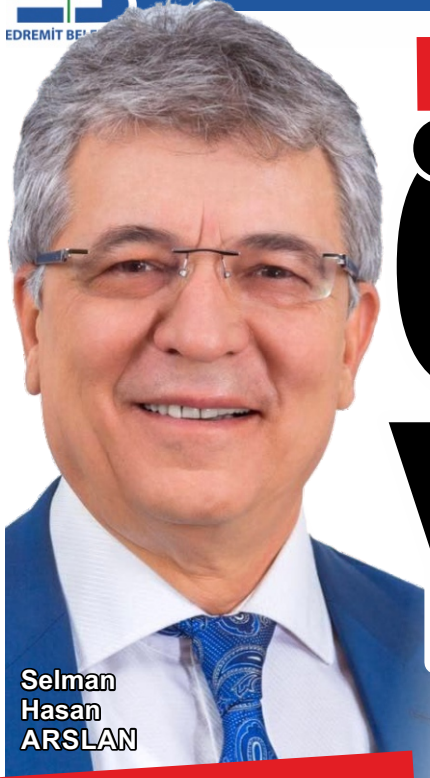
Selman Hasan ARSLAN

Edremit Belediye Başkanı Selman Hasan Arslan, 2020-2021 eğitim öğretim yılının tüm öğretmen ve öğrencilere hayırlı olmasını diledi. Başkan Arslan, "Eğitim öğretim yılı başlarken 300 ailemizin çocuklarının kırtasiye giderlerini karşılıyoruz. Sosyal belediyecilik ilkimiz gereği geleceğimiz olan çocuklarımızın, gençlerimizin yanında olmaya devam edeceğiz" dedi.