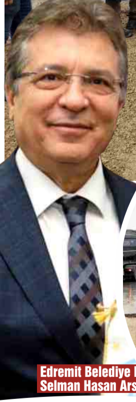
Edremit Belediye Başkanı Selman Hasan Arslan

Edremit'in Tuzcumurat Mahallesi'nde yol düzenleme çalışmalarına devam eden fen işleri ekipleri sıcak asfalt çalışmasıyla yolu yeniliyor. Sağanak yağış ve fırtına sonrası çökme ve bozulma yaşanan yol için seferberlik başlatan ekipleri ziyaret eden Başkan Selman Hasan Arslan da çalışmalarını yerinde inceledi. Çalışanlara kolaylık dileyen Başkan Arslan, yolun kısa süre içerisinde tamamlanarak hizmete açılacağını söyledi.