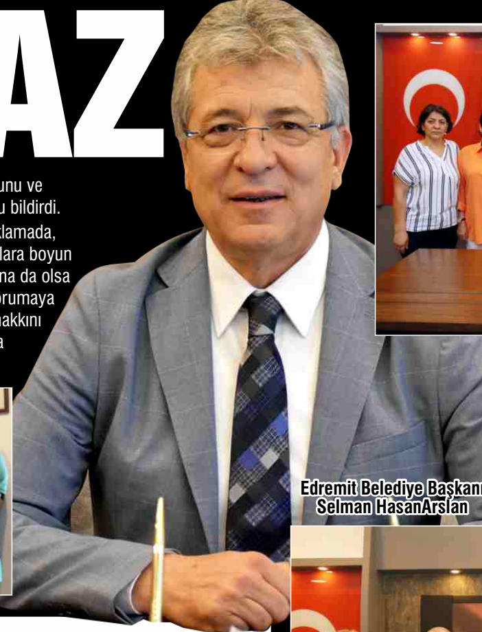
Edremit Belediye Başkanı Selman Hasan Arslan